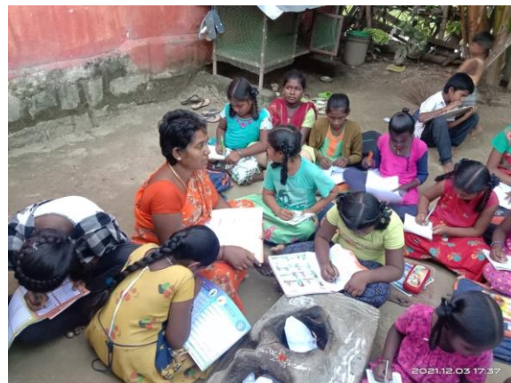
Ci-dessus Olaipadi que nous connaissons bien pour y avoir eu un groupe de formation de femmes.

Les cours du soir ont constitué la colonne vertébrale de l'activité de POPE durant la pandémie, l'objectif était d'éviter le décrochage scolaire alors que les écoles ont été fermées durant des mois. Par ailleurs avec les mesures de confinement les pensionnats de POPE étaient aussi fermés, les seules actions de terrain possibles pour garder le contact ont donc été les activités organisées dans les villages avec des ressources sur place (les institutrices et instituteurs des cours du soir sont toujours des gens du village).