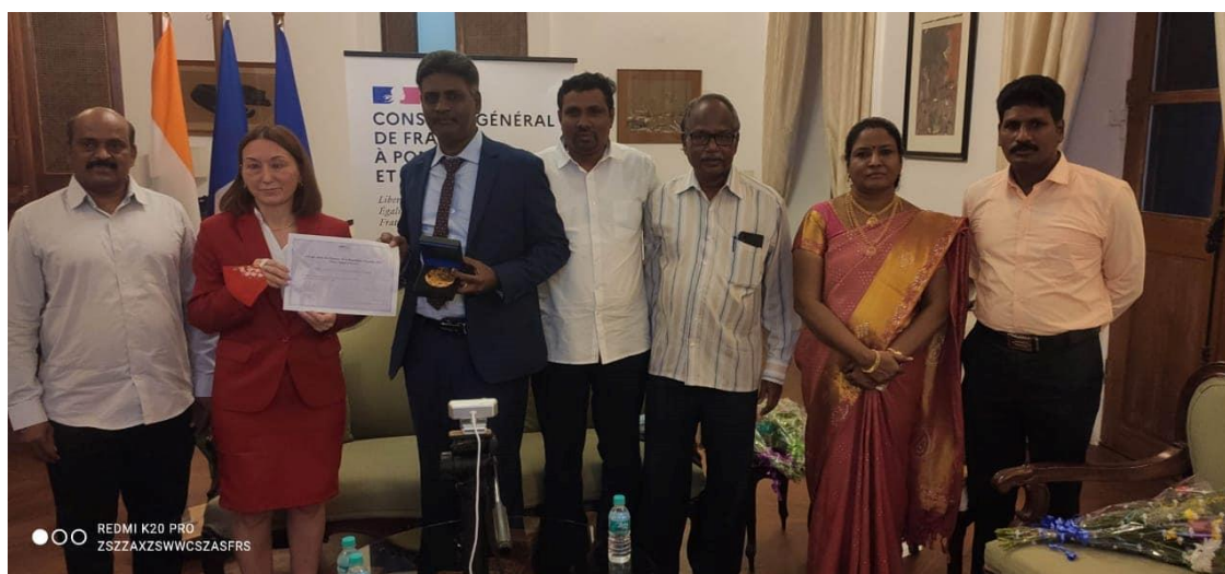
Madame la Consule, Rosario, personnel de POPE, sa sœur et son frère.

reconnaissance des gens pour mon mode de vie et mon travail étaient la vraie récompense. Nous avons accepté ce prix parce que notre partenariat avec la France et le peuple Français date de près de 25 ans et que le bilan du gouvernement français et du peuple français en matière de défense des droits des personnes marginalisées est digne d'éloges et est un modèle pour d'autres pays. Je ressens et crois fermement que la République Française valorise encore très fortement ses mots révolutionnaires de Liberté, d'Égalité et de Fraternité. J'ai été particulièrement attiré par ces valeurs.